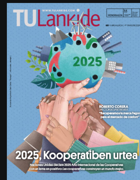
631 Laugarren hiruhilekoa / 4º trimestre.