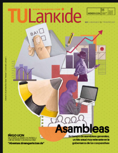
629 Bigarren hiruhilekoa / 2ndo trimestre.