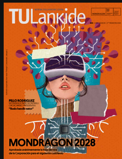
630 Hirugarren hiruhilekoa / 3er trimestre.